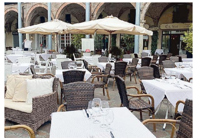
Già 30 tra bar e ristoranti hanno potuto allargare il plateatico